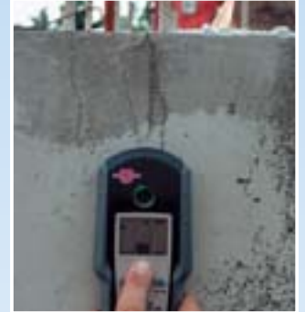
Donatı demirlerinin aranması (bakır)