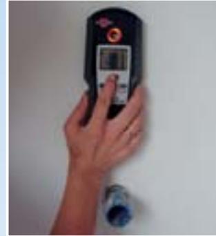
Su borularının aranması (bakır)